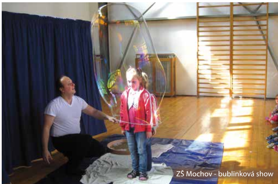
ZŠ Mochov - bublinková show