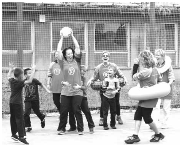
Fotbalový zápas přípravy s maminkami.

se svou zemí a zodpovědnost za ni, proto vybudoval SOKOL jako organizaci vychovávající zdatné, kulturní, vzdělané a hlavně svobodné a zodpovědné lidi.