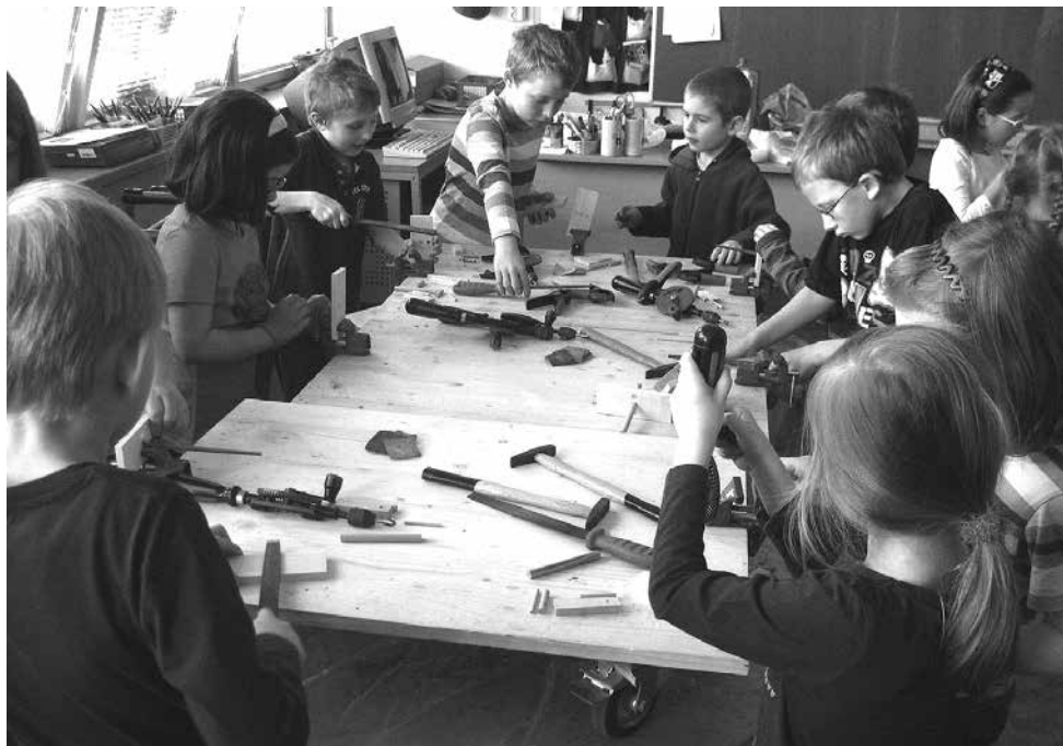
Naši budoucí řemeslníci a technici při praktickém vyučování.

Na konci roku se můžeme pochlubit řadou zajímavých akcí. Z těch „nej“ připomínáme: zážitkové spaní ve škole, divadelní představení v Praze či pozvaná kulturní představení v budově školy, návštěva knihovny, planetária, plavecký výcvik v Neratovicích, Den čarodějů, Den země, Den dětí, ukázka výcviku psích miláčků, účast na rozsvěcení vánočního stromu v obci, vítání nových občánků, exkurze do ZOO, bublinková show, Při vánoční besídce a besídce ke Dni matek předvedli žáci, co se v dramatickém a tanečním kroužku naučili. Nesmíme zapomenout ani na významnou akci školy – Den otevřených dveří.