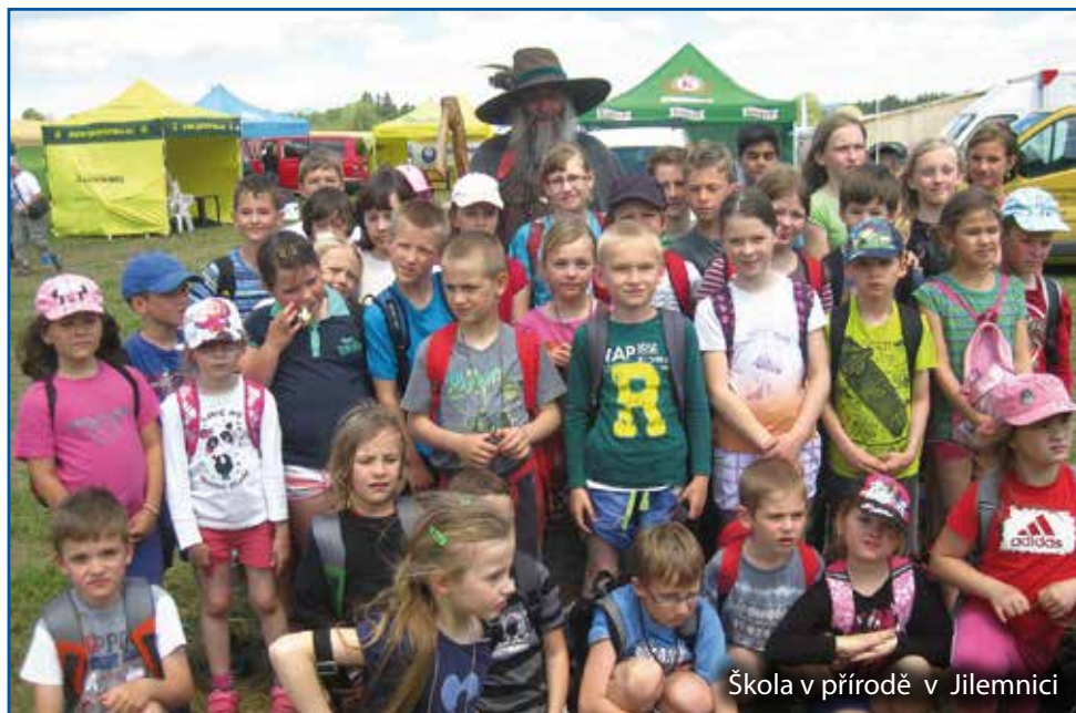
Škola v přírodě v Jilemnici