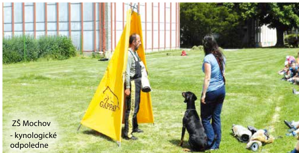
ZŠ Mochov - kynologické odpoledne

MOCHOVSKÝ ZPRAVODAJ. Ročník 8 (rok 2014), číslo 3. Vydává Obec Mochov.