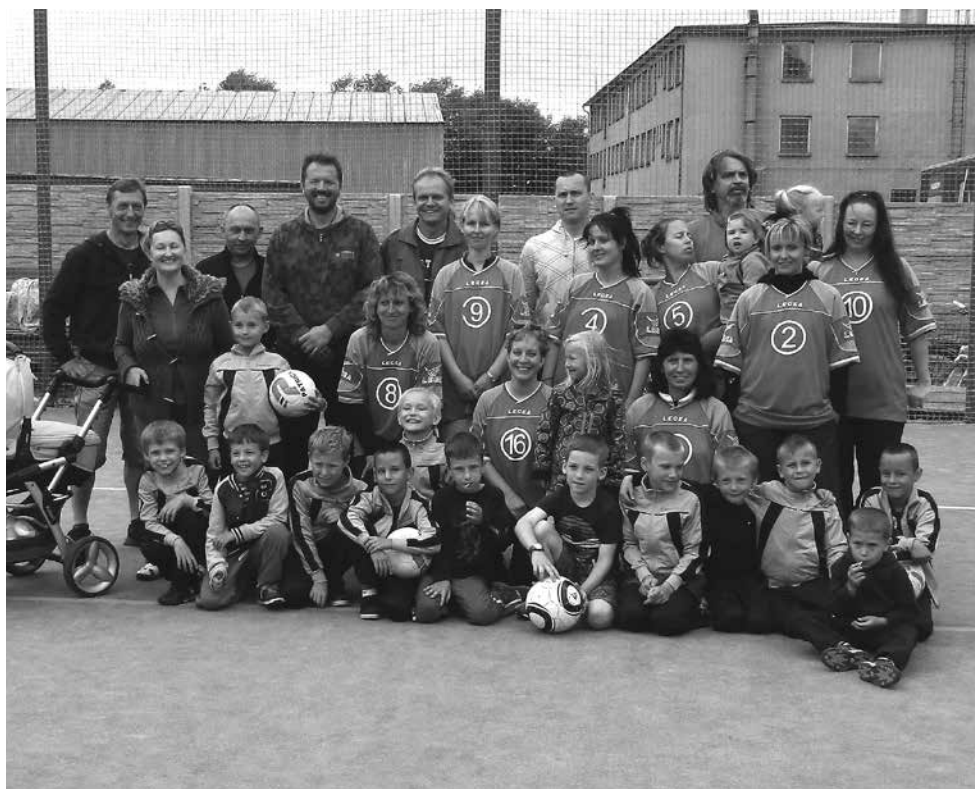
Trenéři, fotbalová příprava a maminky.