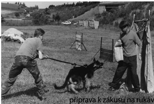
příprava k zákusu na rukáv

Když pachatele najde, nesmí ho napadnout, ale pouze štěká.